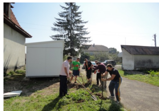
Облаштування молочного пункту в СОК Молочар

За два роки роботи кооперативу у людей змінилися підходи до заготівлі кормів, селекційної роботи та до якості молока, яке реалізовується через кооператив. Під час зустрічей члени правління планують подальший розвиток кооперативу, а на зимові місяці будуть організовувати навчання в громаді.