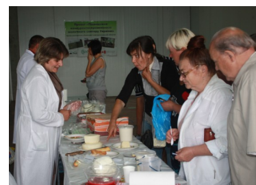
Кооперативи презентують свою продукцію для львів’ян

Виробники-члени кооперативів мають можливість виставляти свої свіжі та якісні молочні продукти у комфортному окремому приміщенні на ринку. Для цього потрібно звернутися до Голови свого кооперативу та надати інформацію про об’єм і асортимент молочних продуктів, що ваше господарство хотіло би реалізувати.