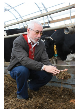
БО ЛАДС надає консультації фермерам та особистим селянським господарствам